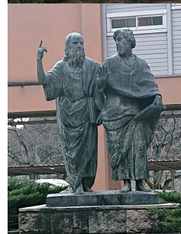
中庭に立つプラトンとアリストテレスの銅像はどうなるか