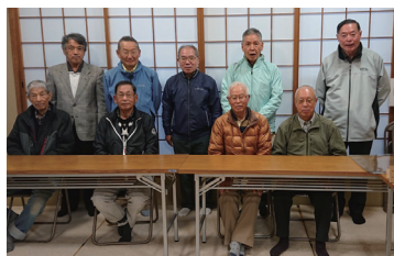
▲大仏鉄道研究会の例会

楽しんで絵を描く絵画のグループ「色季会」は年4回ほど数名が集まり作品を比べる研究会を行っている。時には100号の大作が壁いっぱいに掲示されるという。