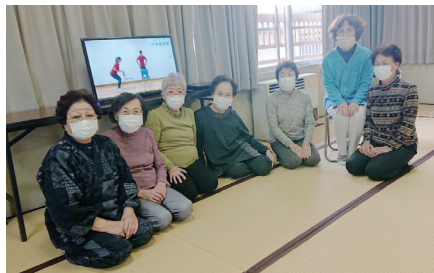
▲長寿で明るく「エクササイズ立花」

2年前の結成20周年では奈良ファミリー内の秋篠音楽堂で発表会を開催。クラシックからシャンソン、抒情歌、歌謡曲までジャンルも幅広く、ピアノと歌唱指導の先生とともに練習を重ねている。