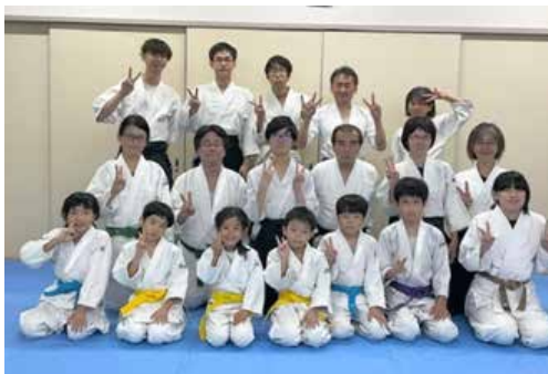
奈良合気会のみなさん