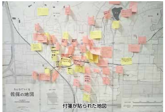
付箋が貼られた地図

今後、佐保ふれあい会館等において、みなさんにお寄せいただいた情報を盛り込んだオリジナル地図をお披露目する予定です。