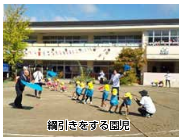
綱引きをする園児

運動会の開催準備として、9月4日、10月2日の両日には、残暑の中、地域の皆様50人余りのご協力により夏の間に繁茂した雑草の除去作業が行われ、きれいな園庭で運動会を迎えることができました。