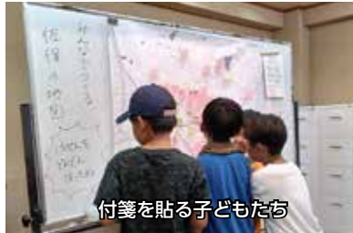
付箋を貼る子どもたち

7～8月の佐保ふれあい食堂において、『みんなでつくる佐保の地図』と題した企画を実施しました。ホワイトボードに掲出した佐保校区の大きな白地図に、参加者が自分の知っているさまざまな情報を付箋で貼り付けていきます。生活者ならではの視点でおススメの場所を教えたり、はたまた道の悪さを指摘したり。小学生の佐保小自慢もたくさん出ました。付箋の貼られた地図を前に、参加者同士で会話が生まれるシーンも見られました。