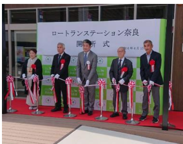
ランステーション開所式

ランニングやジョギングをはじめスポーツを楽しむ人や、市民の憩いの場・生涯スポーツの拠点として、昨秋から奈良