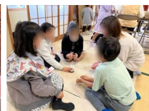
◀ 食堂開催時の様子