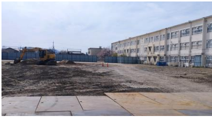
敷地整備工事状況(3月)

両会合では、市教育委員会から佐保小学校敷地に建設される新校舎計画の説明がありました。現在新校舎の詳細設計段階にあり、今秋工事発注が予定されています。今後、地域の方々に向けて新校舎に関する説明の場が設けられる予定です。この他、通学