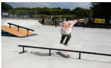
ローラースケートパーク

選手レベルまで4つのエリアが設けられ、熟練度別に安心して練習できるよう配慮されています。用具の貸し出しもあります。