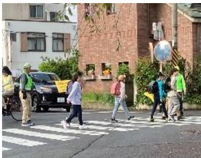
登校風景(大仏鉄道記念公園付近)

翌日からさっそく初々しい1年生も登校です。通学路では地域の皆さんによる見守り活動が長年続けられています。黄緑色のゼッケンをつけ