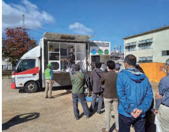
起震車に並ぶ住民(上) 避難訓練(右上) 搬送訓練(右下)