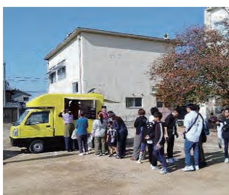
人気のキッチンカー