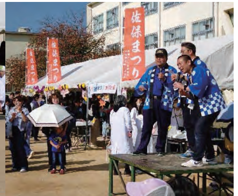
かわいい獅子舞……飛び入り3人男組も