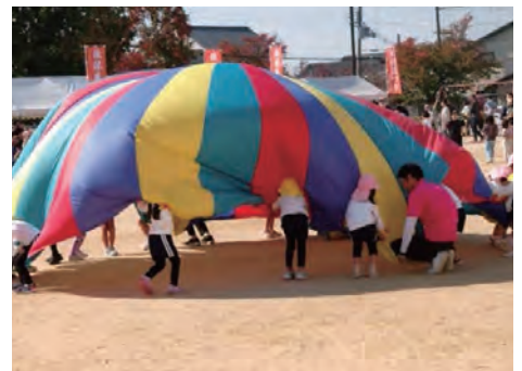
佐保幼稚園児の遊戯