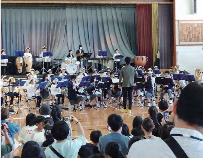
佐保小マーチングバンドと 若草中吹奏部のコラボ演奏