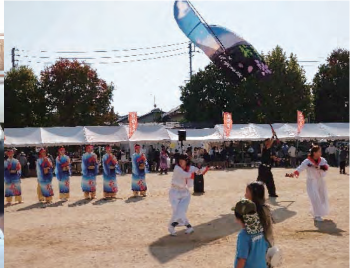
花柳会と桜花会のバサラ踊り