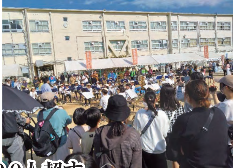
佐保小マーチングバンド演奏で開幕

第3回佐保まつりが快晴の11月5日、4年ぶりに開催されました。会場の佐保小学校には約2500人が入り、地域交流の輪が広がりました。今回から登場した「みんなで作る佐保まつり100円寄金」には700人を超す協力がありました。企業、団体、自治会、個人からの協賛金協力も92件、84万円余が集まりました。(2、3面に収支報告、協賛企業などの一覧、写真に掲載しています)